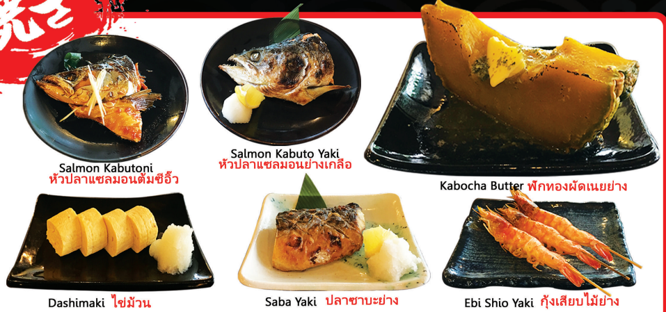
Salmon Kabuto Yaki หัวปลาแซลมอนต้มซีอิ๊ว