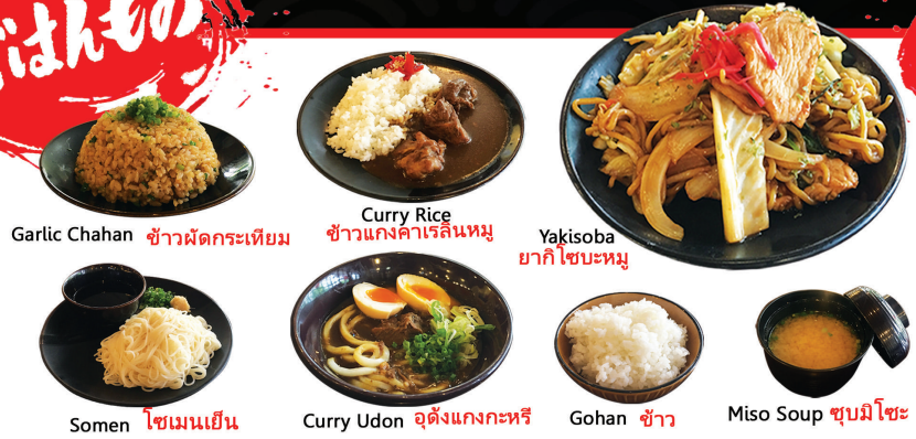
Garlic Chahan ข้าวผัดกระเทียม