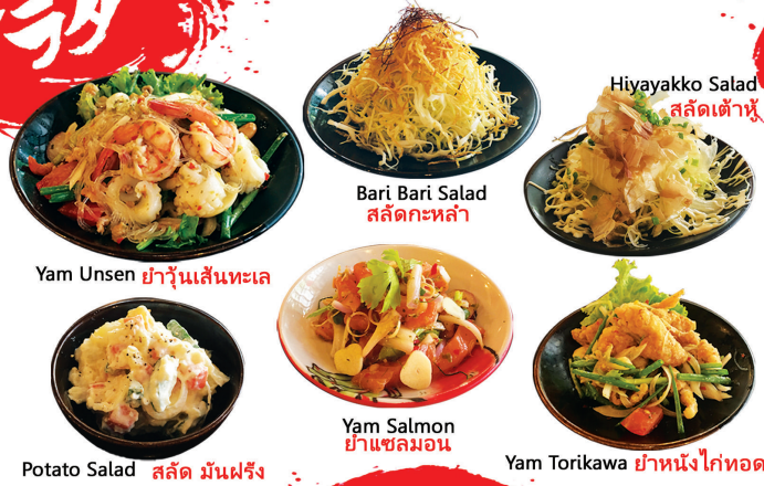
Yam Unsen ยำวุ้นเส้นทะเล