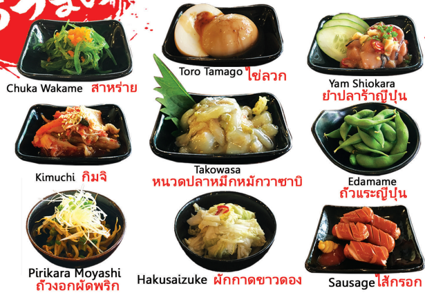
Chuka Wakame สาหร่าย