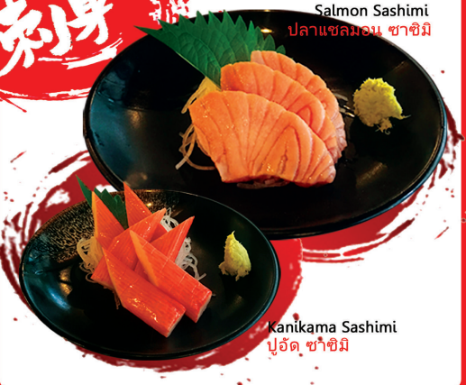
Salmon Sashimi ปลาแซลมอน ซาชิมิ