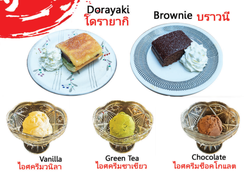
Dorayaki ไดร่ายากิ